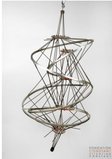
Constant, Lijn zonder einde , 1958, 145 x 70 x 70 cm, perspex, verf, aluminium, koperdraad en ijzer. Foto: Tom Haartsen. © Fondation Constant c/o Pictoright 2016.