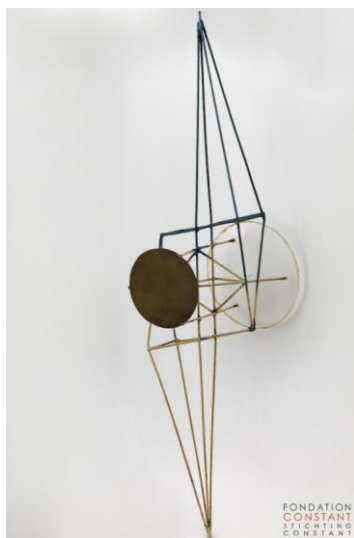
Constant, Schaalmodel voor draaibare constructie , 1956, 44 x 11 x 9,5 cm, ijzer,