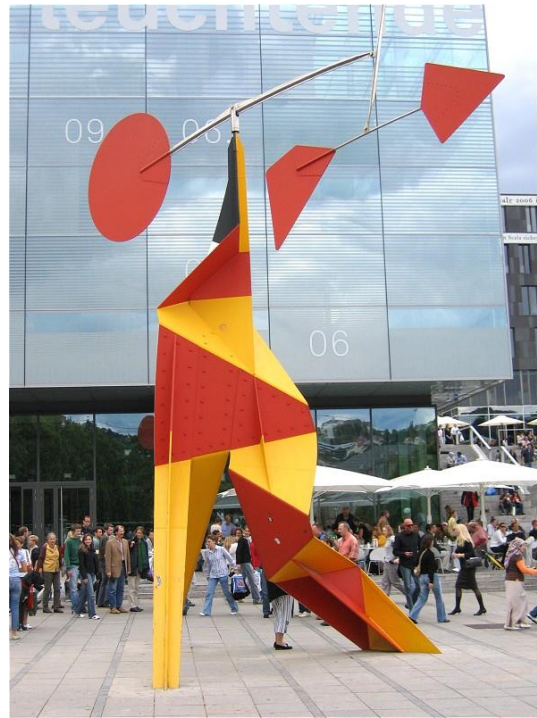
Alexander Calder, Crinkly avec disc rouge , 1973, 8 meter hoog, staal en verf, Schlossplatz in Stuttgart, Duitsland.