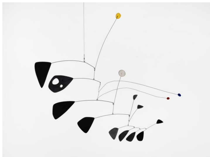
Alexander Calder, Antennae with Red and Blue Dots (Antenne met rode en blauwe stippen) , 1953, aluminium en staaldraad, 111 x 128 x 128 cm, Tate Modern ©