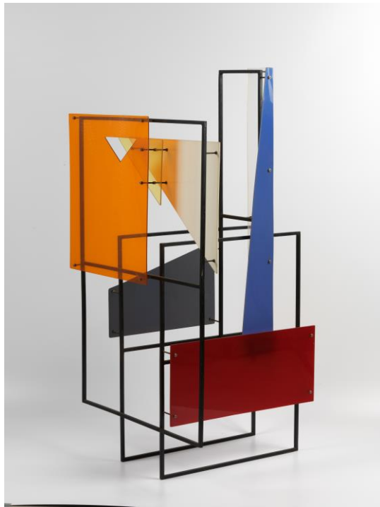
Constant, Constructie met gekleurde vlakken , 1954, 120 x 62 x 57 cm, plexiglas en zwart staal, Collectie Fondation Constant.