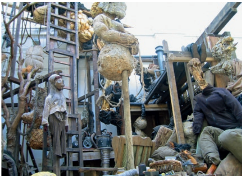
The Laboratory Of Life , 2008 (detail), Courtesy Upstream Gallery Amsterdam © Izaak Swartjes 2009