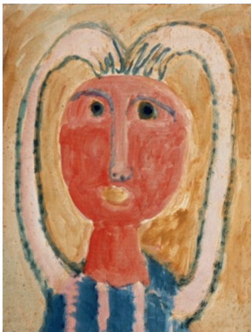
Eugène Brands, Meisjesportret / Girl's Portrait 1951, aquarelverf op papier / watercolour on paper 50,5 x 38,5 cm. © Stichting Eugène Brands Foto / Photo Henni van Beek

Sparkling, colourful and summery, active and re-creative: this educational Cobra exhibition includes many works of art from the museum collection, as well as films and photographic material. It is a true family exhibition that shows how the young Cobra artists inspired one another to create very experimental art: paintings, drawings, prints, sculptures, ceramics and written works. These artists not only worked in the seclusion of their studios, but organized family sessions to make art together with their whole families.