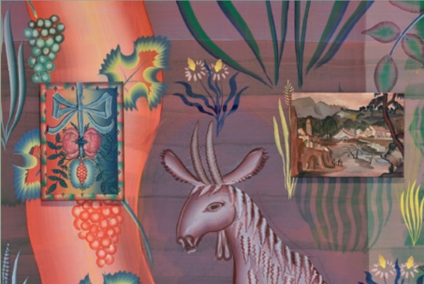
A mon seul desir , 2008 (detail), muurschildering/installatie wall painting/installation Bonnefantenmuseum Maastricht © Gijs Frieling 2009.

Winnaar 2009 Cobra Kunstprijs Amstelveen Winner of the 2009 Cobra Art Prize Amstelveen