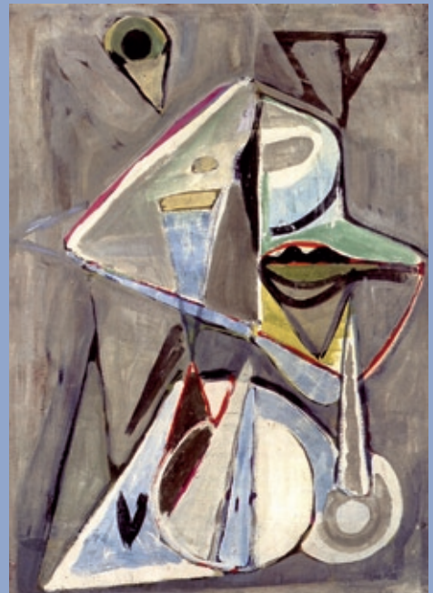
Bram van Velde, Zonder titel / Untitled Paris-Montrouge 1941 gouache op karton / watercolour on cardboard 105 x 74,5 cm. Colmar, Musée d'Unterlinden

In the 1940s and 1950s, Paris was the centre of European art. Famous artists, such as Jean Dubuffet, Rogier Bissière, Karel Appel, Jean Fautrier, Hans Hartung, Asger Jorn, Georges Mathieu, Nicolas de Staël, Serge Poliakoff and Bram van Velde all chose to live in this vivacious and inspiring city. In this exhibition, an ode to lyrical abstraction, action painting, l'art informel and material painting, masterpieces have been brought together from the oeuvres of over thirty European masters. An exhibition of this nature is long overdue, as it investigates a period that generated so much interesting and beautiful art – by artists who intensively and diligently experimented in the age of the reconstruction. They were not only French and Dutch artists, but also German, Italian and Spanish, Danish and Belgian, for they were all working in Paris.