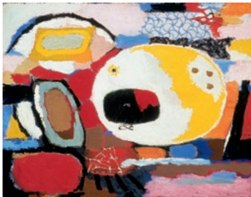
Landschappelijk / Of Landscape 1947 olieverf op doek oil on canvas 61 x 65 cm. Particuliere collectie Private collection

In samenwerking met Waanders Uitgevers verschijnt er een gelijknamige boekuitgave (ISBN 978 90 400 8633 5). In cooperation with Waanders Uitgevers a publication will be released.