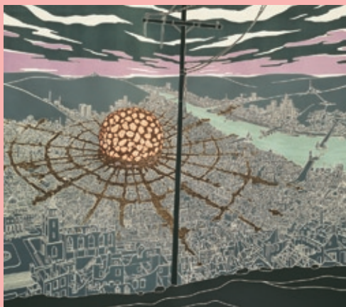
Epicenter 2007 Linoleumprint / silkscreen and watercolour on paper 201 x 180 cm Edition of 5 + 1 AP © Rob Voerman 2009