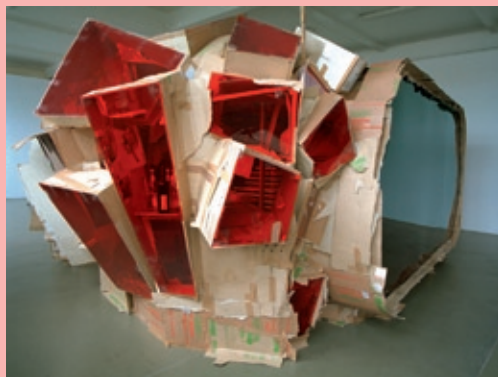
Real Estate 2006 Cardboard, plexi-glass a.o.m. 500 x 500 x 210 cm Unique piece © Rob Voerman 2009

Where in the 1950s and '60s, Constant Nieuwenhuys developed his revolutionary Nieuw Babylon concept as an achievable utopia, Rob Voerman (b. 1966) now creates informal, improvised architectural constructions that partly evolved from his criticism of existing cultural, social and financial systems. Voerman creates spatial architectural models and assemblages, an architecture of fictitious societies within remote or busy urban structures. He also expresses these ideas in watercolours and prints. Voerman's spatial constructions are built up of organic materials, worked in bricolage-like methods. In an extension of the models, the watercolours and prints show spherical impressions of urban and industrial landscapes. Rob Voerman's work is not simply negative or dark. It also offers openings towards a different approach to our own time.