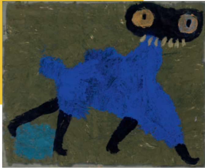
Paul Klee, Blau mantel , 1940 (7), oil and wax paint on paper on cardboard Collection Albertina, Vienna © Zentrum Paul Klee, Bern