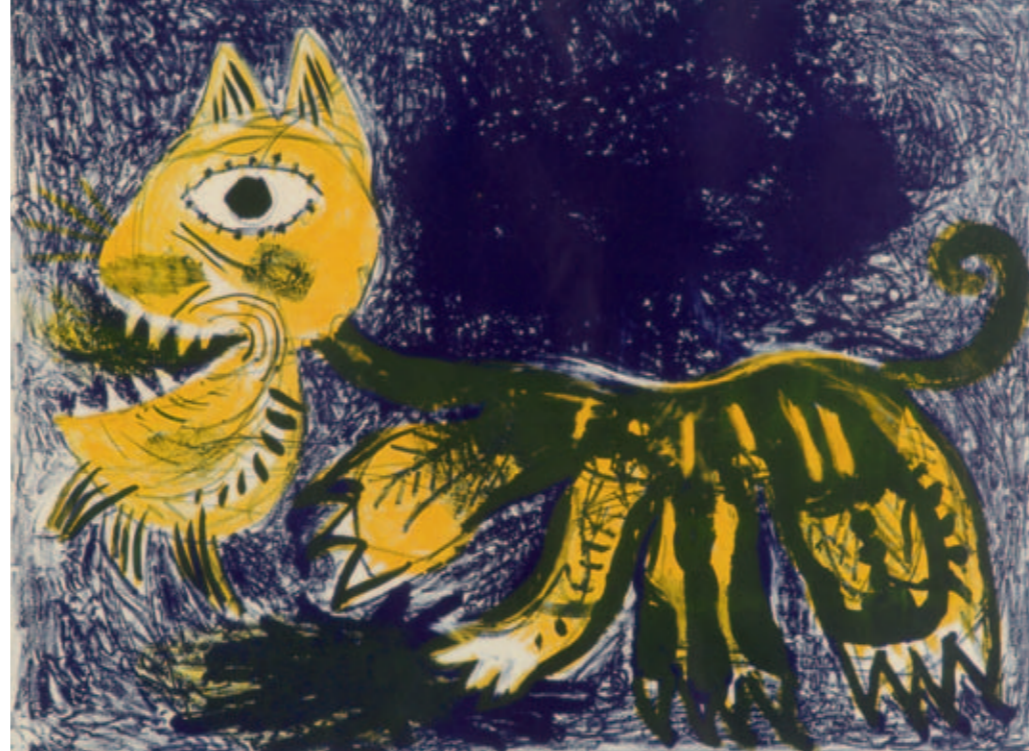
Constant, Kat , 1949, litho, 5/6 © Pictoright Amsterdam 2011