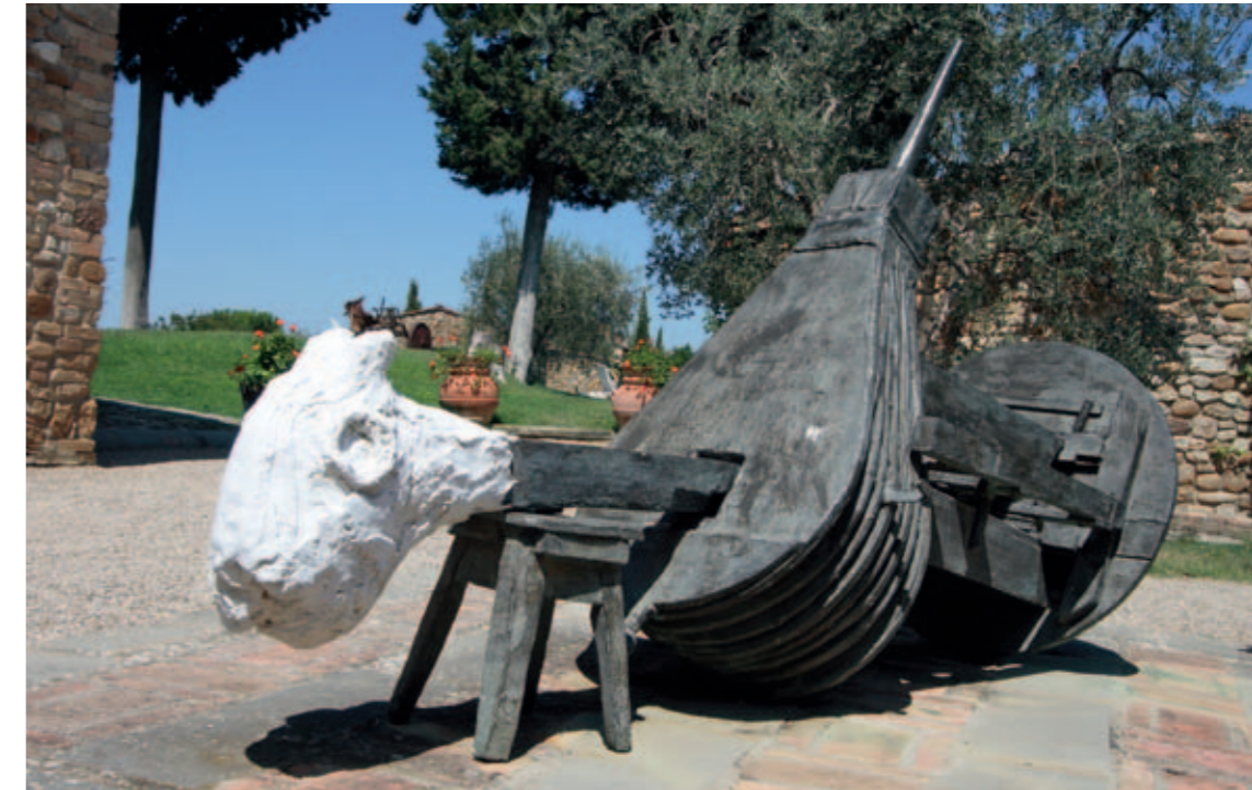
Karel Appel, Donkey , 1991, painted bronze. Collection Giulio Baruffaldi, Tuscany

museum voor moderne kunst museum of modern art