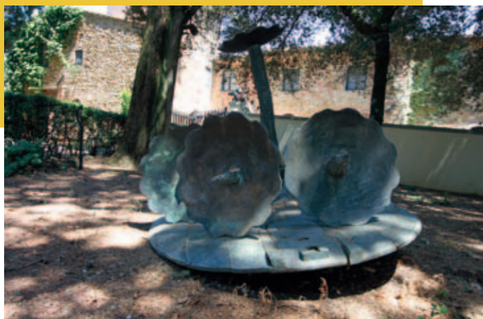
Karel Appel, Daisies , 1991, bronze. Collection Giulio Baruffaldi, Tuscany