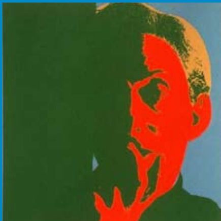
Deborah Kass, Portrait of the Artist as a young man (1994) (detail)

Wat hebben kunstenaars te zeggen over identiteit? Sommige kunstenaars nemen zichzelf als onderwerp van hun kunstwerken. Ze maken bijvoorbeeld zelfportretten of beelden van hun eigen leven. Wat zegt die kunst over wie zij zijn? En waarom laten ze dat op deze manier zien?